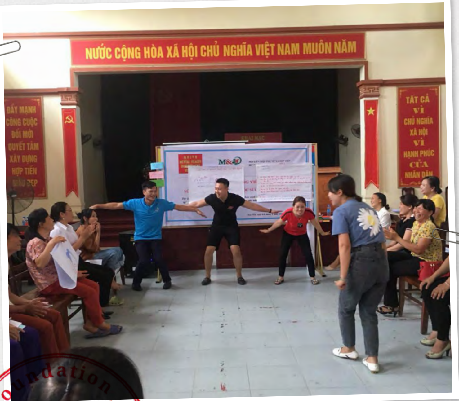
Pilot reproductive health Hop Tien