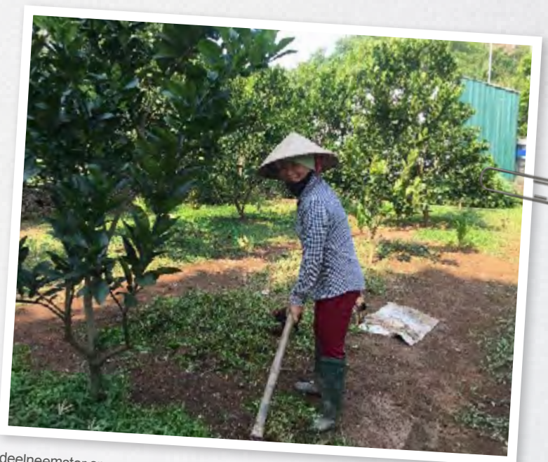
deelnemster spaar- en microkredietproject

De groepsleider is verantwoordelijk voor het verzamelen van het geld van de leden en om het geld naar de People's Credit Fund te brengen om te sparen. Na een jaar kunnen leden die geld nodig hebben het van de bank halen. Omdat het spaargeld bij de bank gestort is, moeten de leden zich schikken naar de regels van de bank, zoals variabele rentetarieven. Het huidige rentetarief is 4,3%. Voor Vietnamese begrippen is dit laag en wordt het model dus vooral gebruikt om te sparen en niet om er extra geld mee te verdienen.