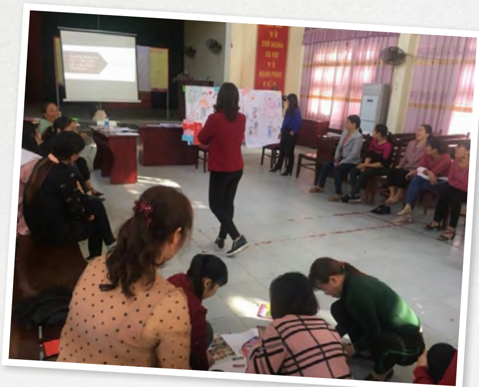
Pilot reproductive health

Klik hier voor meer informatie over de pilot Reproductive Health.