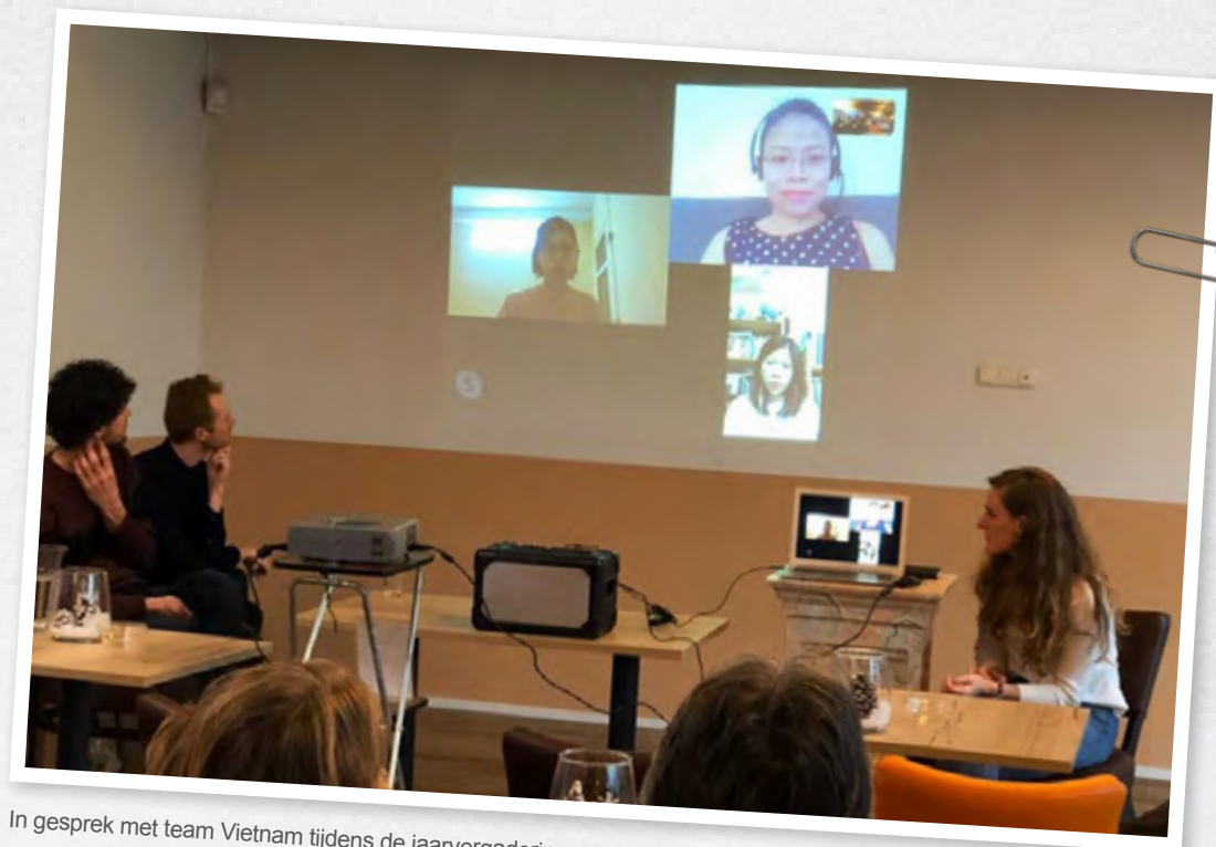
In gesprek met team Vietnam tijdens de jaarvergadering