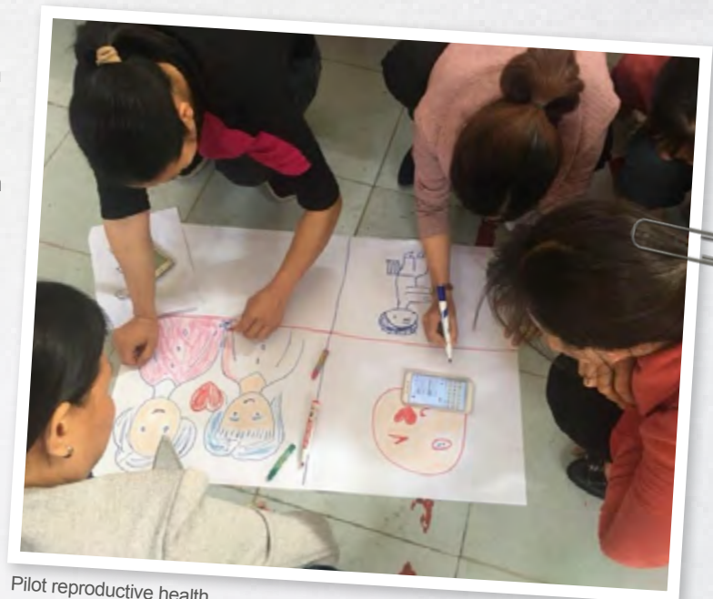
Pilot reproductive health

De lessen en trainingen werden door alle partijen (docent, lokale autoriteiten, deelnemers) als succesvol en boven verwachting positief beoordeeld. Het project heeft er volgens de