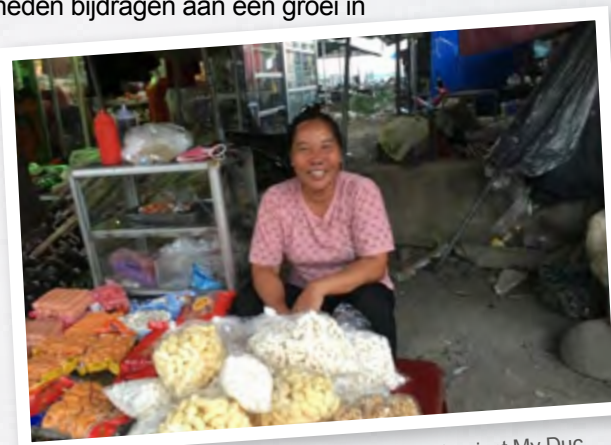
Deelnemster spaar- en microkredietproject My Duc

We kiezen voor deze aanpak omdat wij verwachten dat de groep mensen die buiten de Vietnamese samenleving staat, de komende jaren niet zal profiteren van de economische groei die Vietnam nu doormaakt. Het opbouwen van economische onafhankelijkheid is daardoor niet mogelijk, met armoede als gevolg.