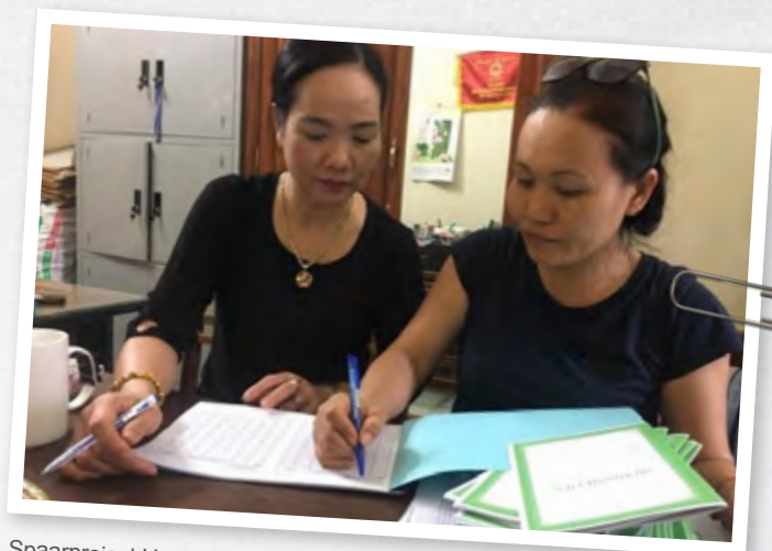
Spaarproject Huong Son

Het project loopt door tot december 2021 en de VSLA-activiteiten worden tot die tijd voortgezet. In de planning staat nog het opzetten van twee kennisgroepen op het gebied van landbouw en kleine bedrijvigheid. Ook zal er nog een trainingsprogramma worden uitgevoerd met als onderwerpen: business planning, financieel management en persoonlijke financiën.