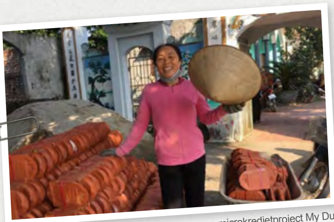
Deelnemster spaar- en microkredietproject My Duc

Om informatie en voorlichting over MHIVN te geven, presenteert de stichting zich meerdere malen per jaar op lokale markten/braderieën, netwerkbijeenkomsten of op uitnodiging voor een geïnteresseerde partij. Ook organiseert MHIVN jaarlijks een stichtingsdag waar we donateurs en belangstellenden informeren over de lopende projecten. Naast deze fysieke bijeenkomsten ontvangen alle belangstellenden en donateurs het jaarverslag (digitaal), evenals digitale nieuwsbrieven/nieuwsupdates. Dit wordt aangevuld met nieuwsberichten op de website en eventueel projectbladen.